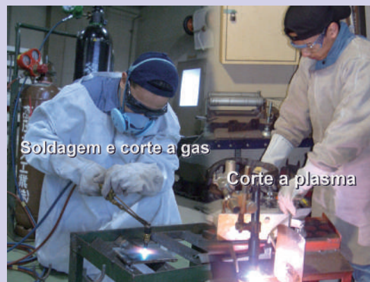
Soldagem e corte a gás

Horário do treinamento: das 8:30 am às 3:40 pm