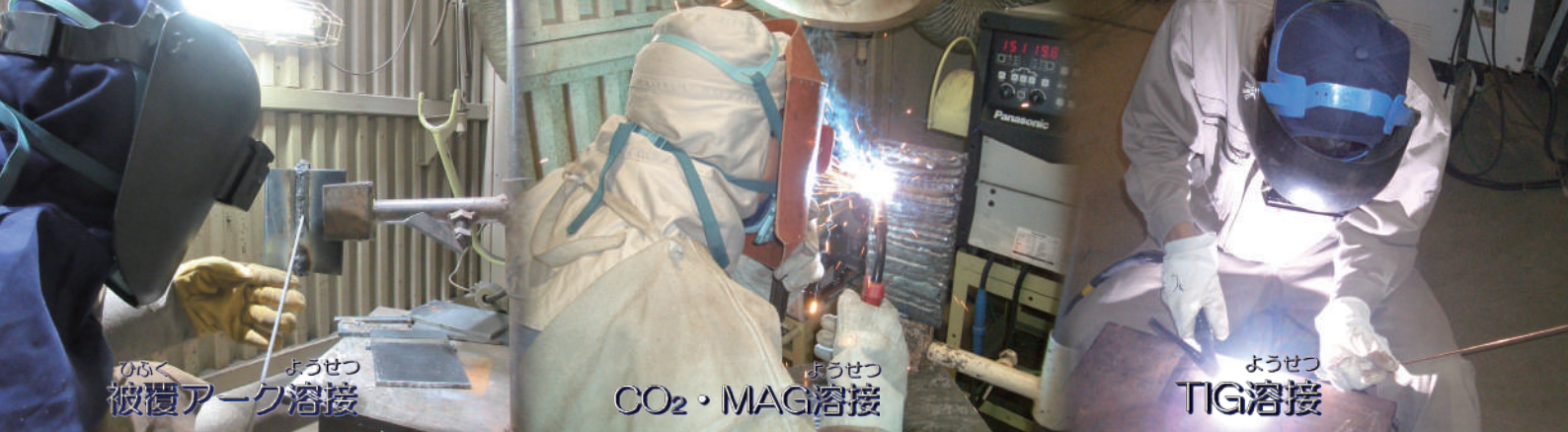
ひぶく ようせつ 被覆アーク溶接