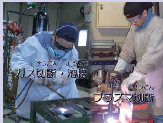
せつだん ようせつ ガス切断・溶接