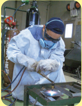
Soldagem e corte a gas