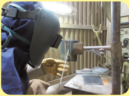
Soldagem eletrodo revestido