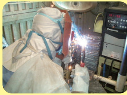
ようせつ CO 2 ・MAG溶接