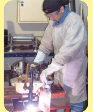
せつだん プラズマ切断