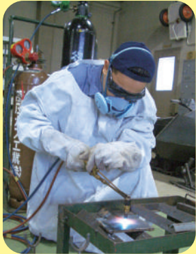
Soldadura y corte a gas