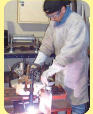
Corte a plasma