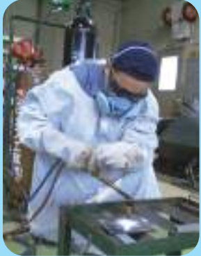
Soldagem e corte a gas