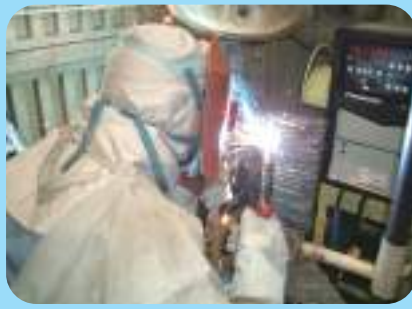
Soldadura CO 2 ・MAG