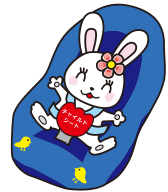
チャイルドシート着用推進 シンボルマーク「カチャビヨン」