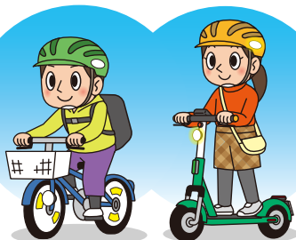
ヘルメットを着用しよう!