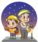
左右を確認しよう!