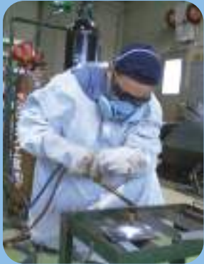
Soldagem e corte a gas