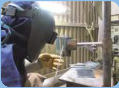
Soldagem eletrodo revestido