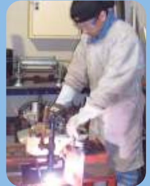
Corte a plasma