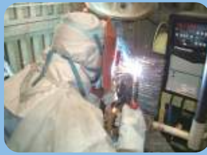
Soldadura CO 2 ・MAG