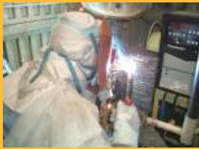
Soldagem CO 2 ・MAG