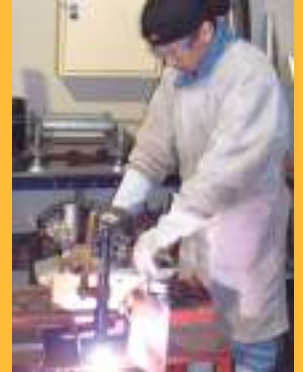
Corte a plasma