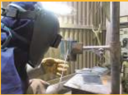
Soldagem eletrodo revestido