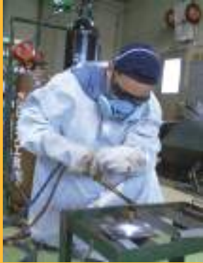
Soldagem e corte a gas