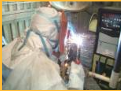
CO 2 ・MAG溶接