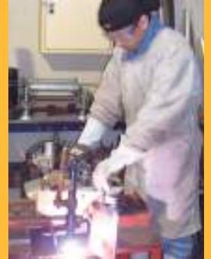
Corte a plasma