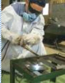
soldadura y corte a gas