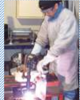
corte a plasma

Para los extranjeros que tengan visa la cual les permita trabajar.