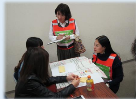
外国人避難者対応の実践 (ベトナム語)