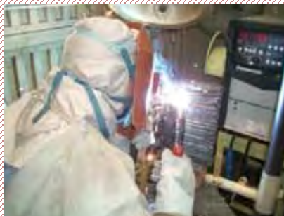
soldagem MIG • MAG