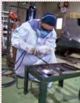
soldagem e corte a gas