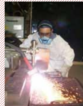
corde a plasma

Para os estrangeiros que possuam o visto o qual os permitam trabalhar.