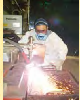
corte a plasma