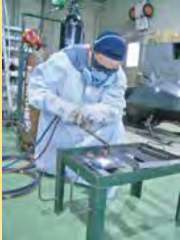
soldagem e corte a gas