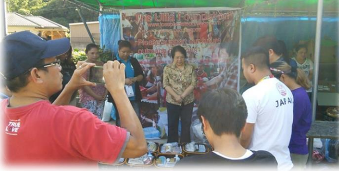
Miyembro ng Filipino Community na namimigay ng pagkain sa Evacuation Shelter

Bilang dayuhan, ano ang ating magagawa para sa komunidad?