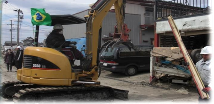
Brazilian na tumutulong sa paglilinis sa Disaster Area